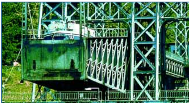
U-Tipp Ausflug zu den Schiffshebewerken bei La Louvière. Dieses UNESCO-Weltkulturerbe stammt aus den Jahren 1888-1917 und überwindet in 4 Stufen insgesamt 68 Höhenmeter.

Der Hennegau ist ein Urlaubsland voller Vielfalt: idyllische Landschaften, Waldgebiete, Flüsse und Kanäle, Städte mit historischem Stadtkern – hier finden Sie alles. Tournai ist nach Tongeren die älteste Stadt Belgiens, die Kathedrale Notre-Dame ist eines der schönsten Beispiele der romanischen Architektur in Westeuropa. Mons ist die Hauptstadt des Hennegaus und das Herz dieser Region.