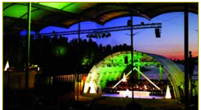
U-Tipp Carmen Georges Bizets Oper als Open Air Event auf der Seebühne Bremen, Juni. ●●● Carmen Georges Bizet's opera as an open air event on the “sea stage“ in Bremen, June.